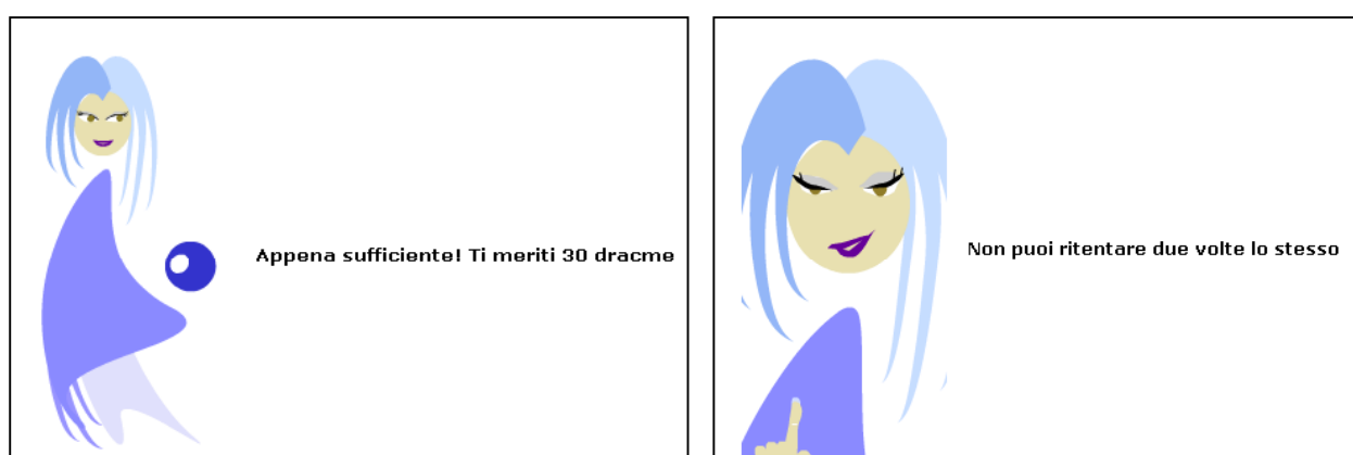
Fig 3 - Ipazia

Strumenti : quiz vero/falso o risposte multiple, esercizi online (tracciati dalla piattaforma)