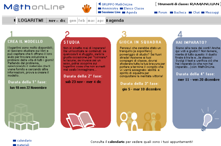
Fig 2 – Le quattro fasi didattiche

1. CREA IL MODELLO (durata: 5 giorni ca.): propone un'applicazione pratica anticipativa rispetto ai contenuti e guida lo studente nella costruzione del modello matematico risolutivo.